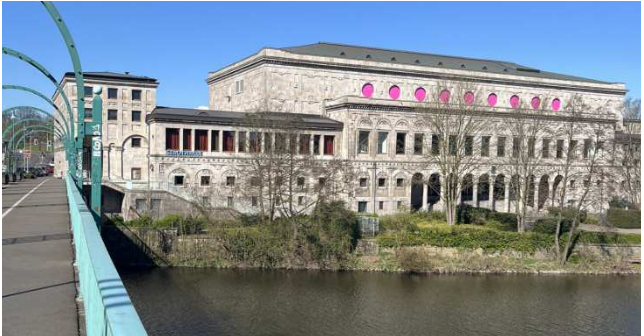
Stadthalle - Ansicht Ost