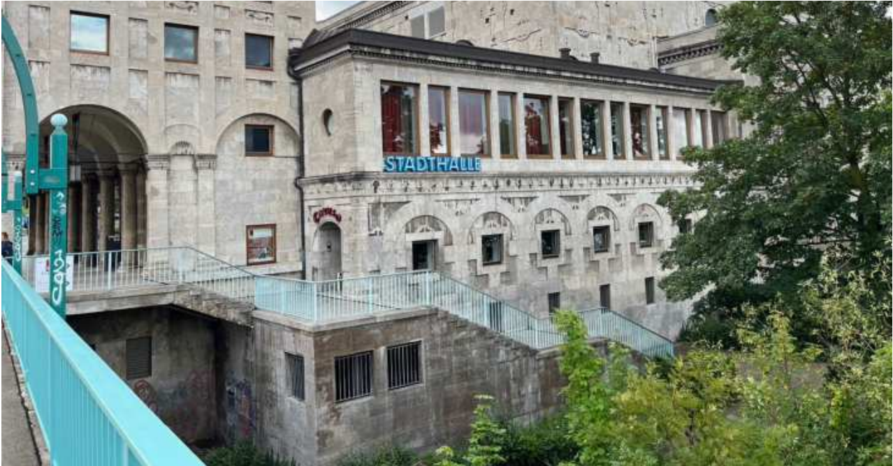
Stadthalle - Freitreppe