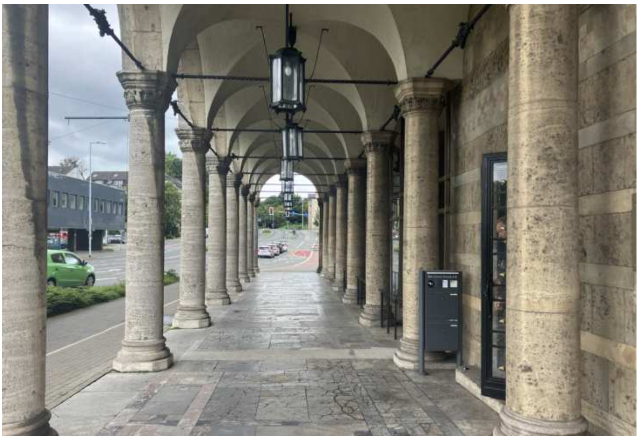
Arkadengang- Blickrichtung West