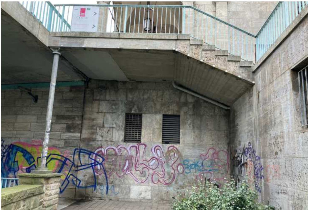
Untergeschoss der Stadthalle unterhalb der Freitreppe