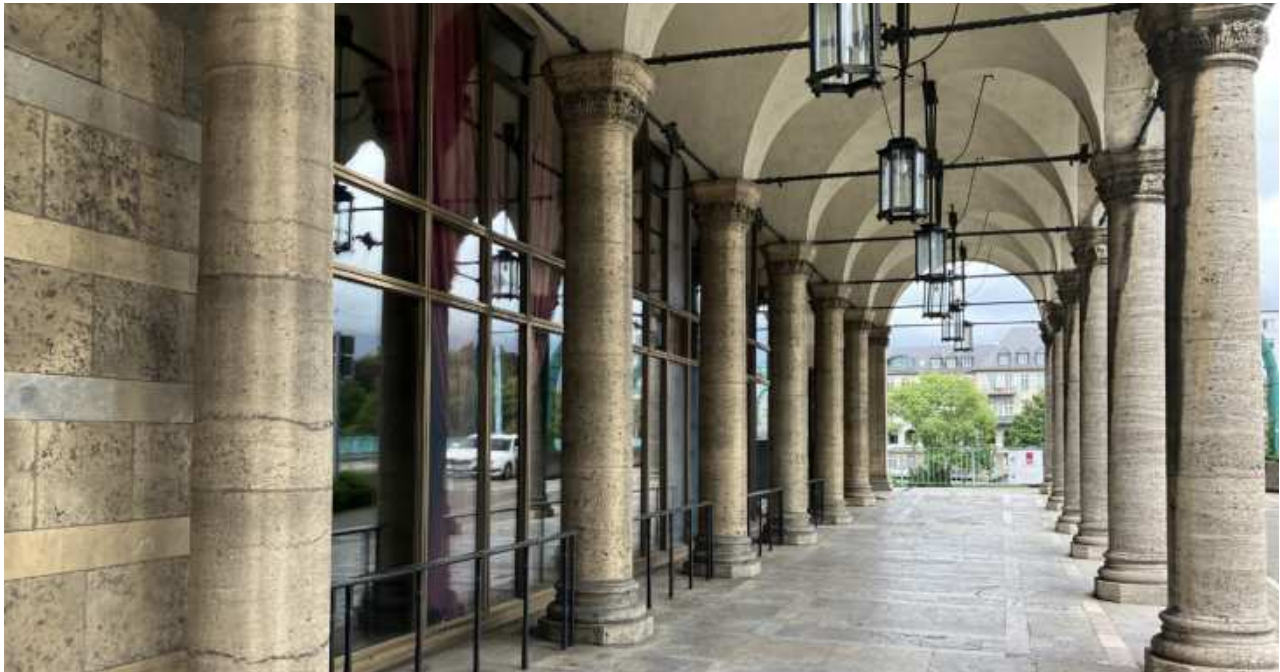
Arkadengang- Blickrichtung Ost