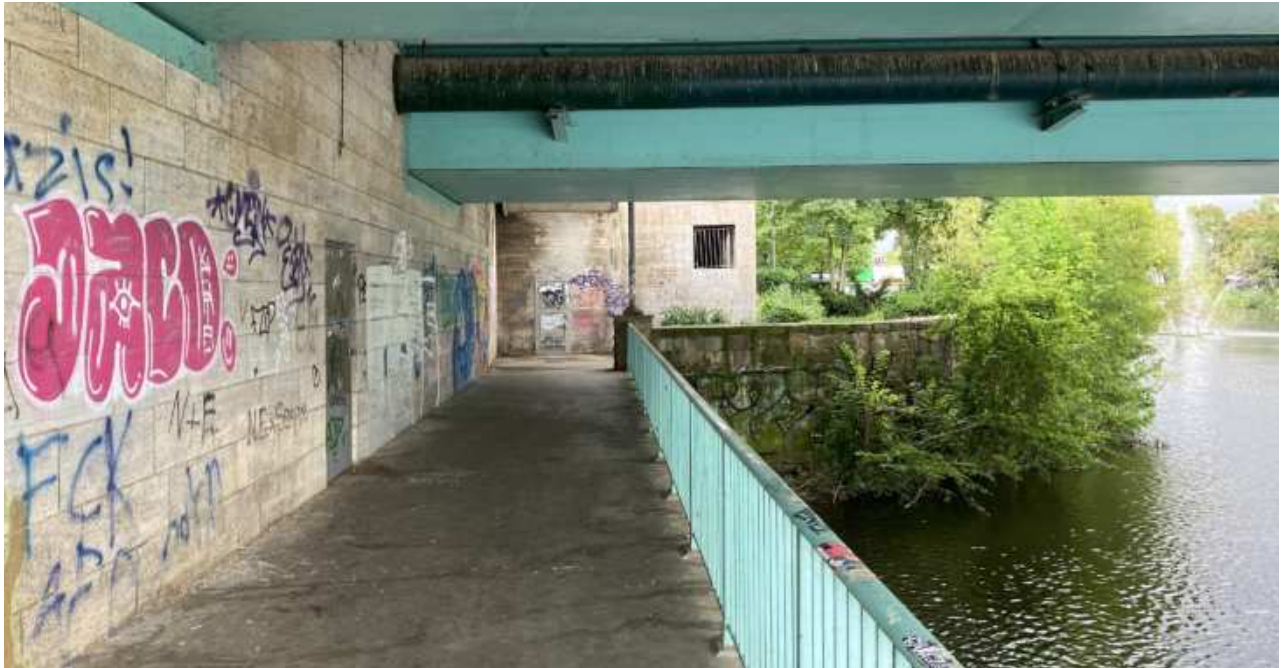
Zugang unterhalb der Schlossbrücke