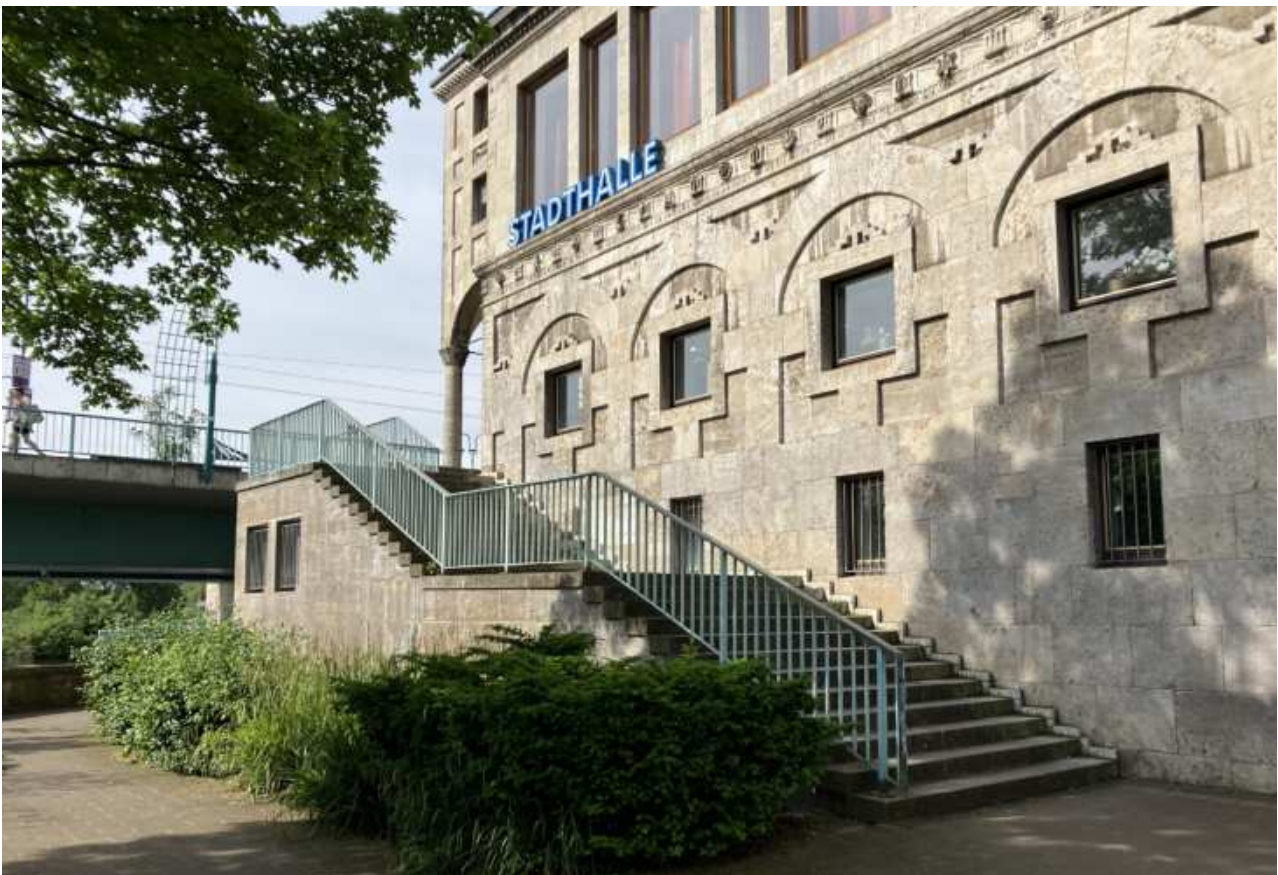
Stadthalle - Freitreppe