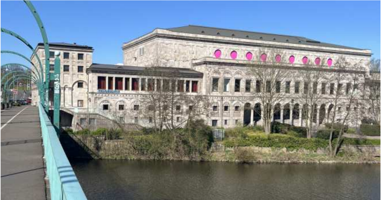
Stadthalle - Ansicht Ost