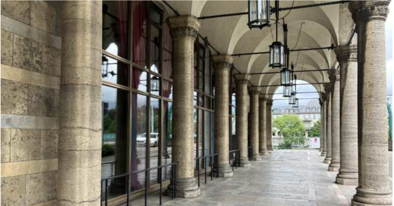
Arkadengang- Blickrichtung Ost