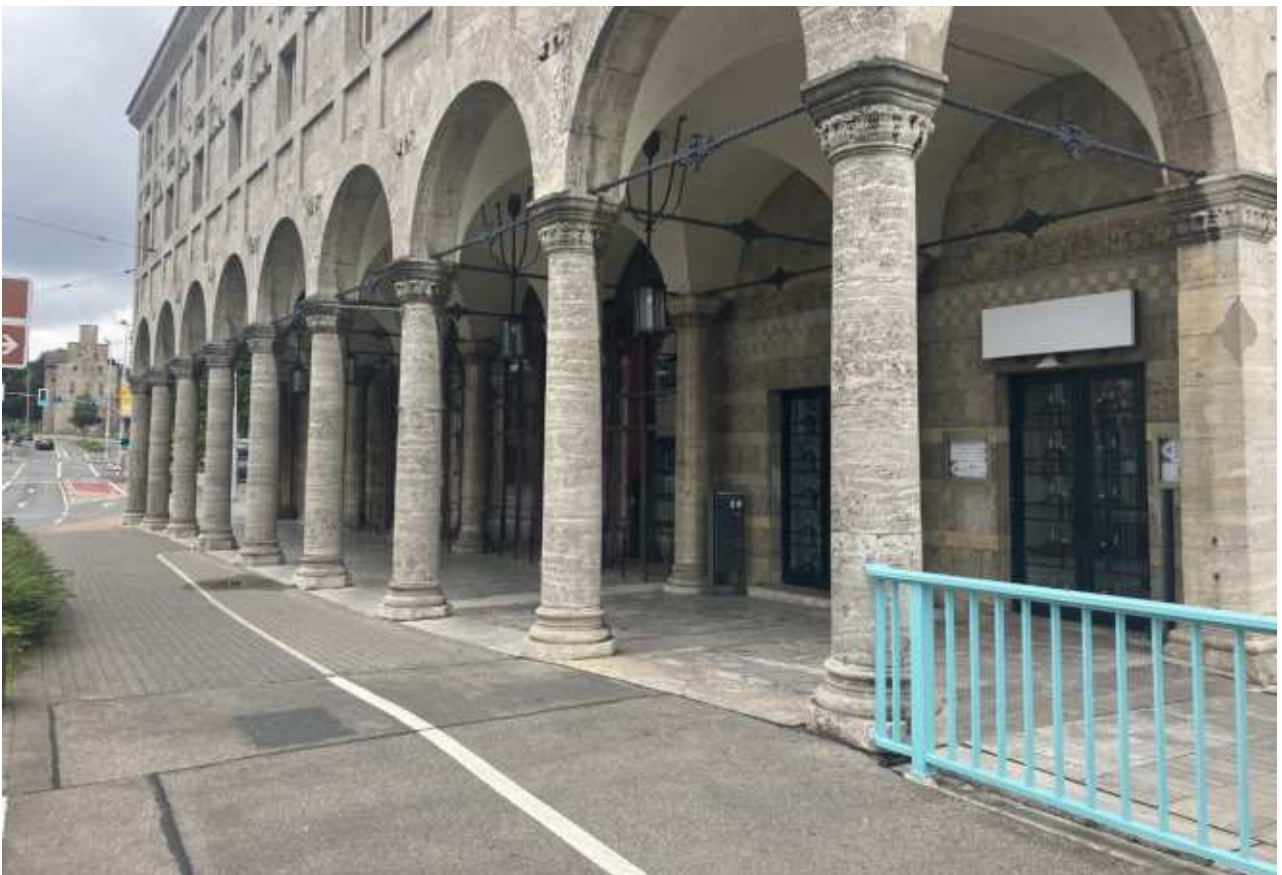
Arkadengang mit angrenzendem Radweg