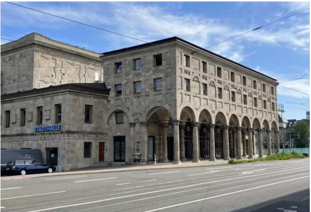
Stadthalle - Ansicht Süd-West