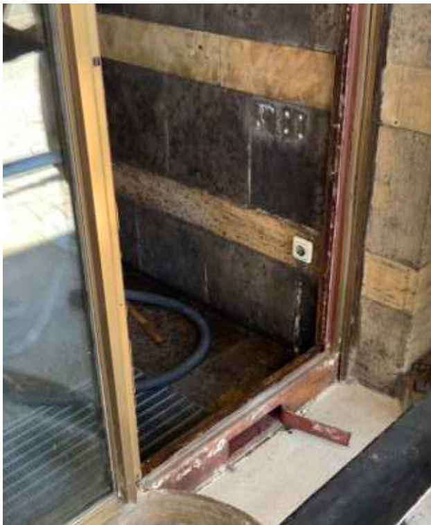
Öffnung Stahlhohlprofil im Sockelbereich