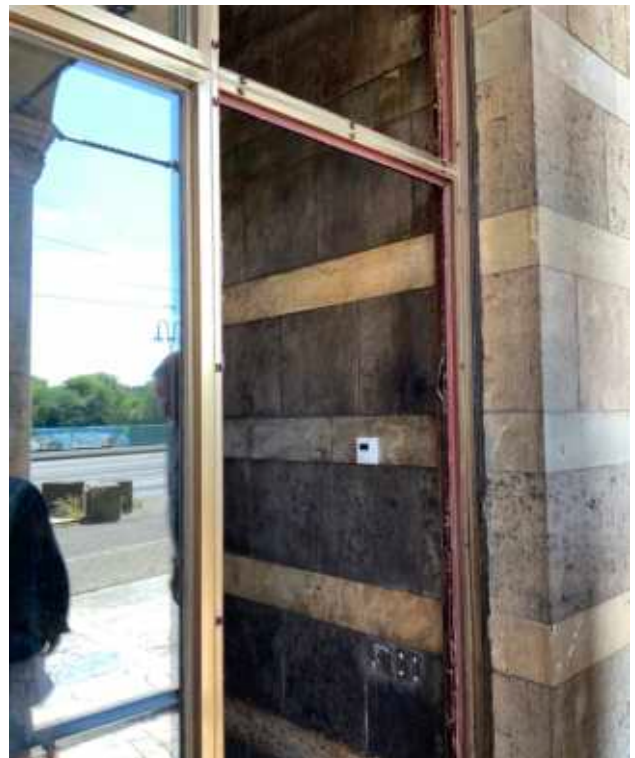
Flachprofile aus Aluminium mit Befestigungsclips