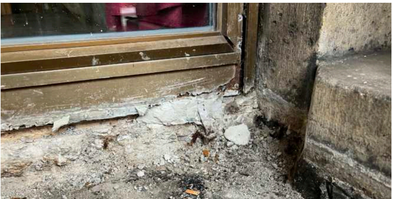
Freilegung des Sockelbereichs