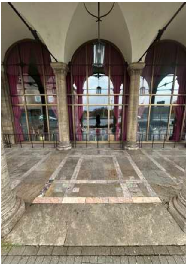
Stahl-Glas-Fassade (Felder 1-3)