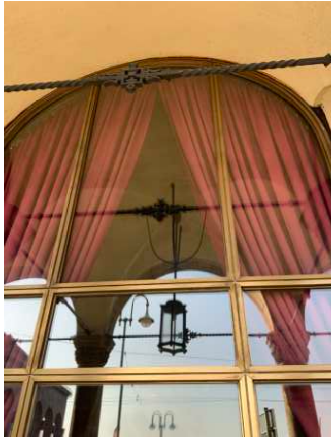
Fassade mit messingfarbenen Zierleisten aus Aluminium