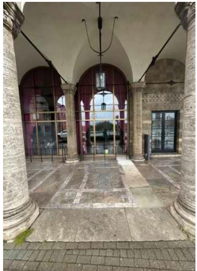
Stahl-Glas-Fassade (Felder 3-4)