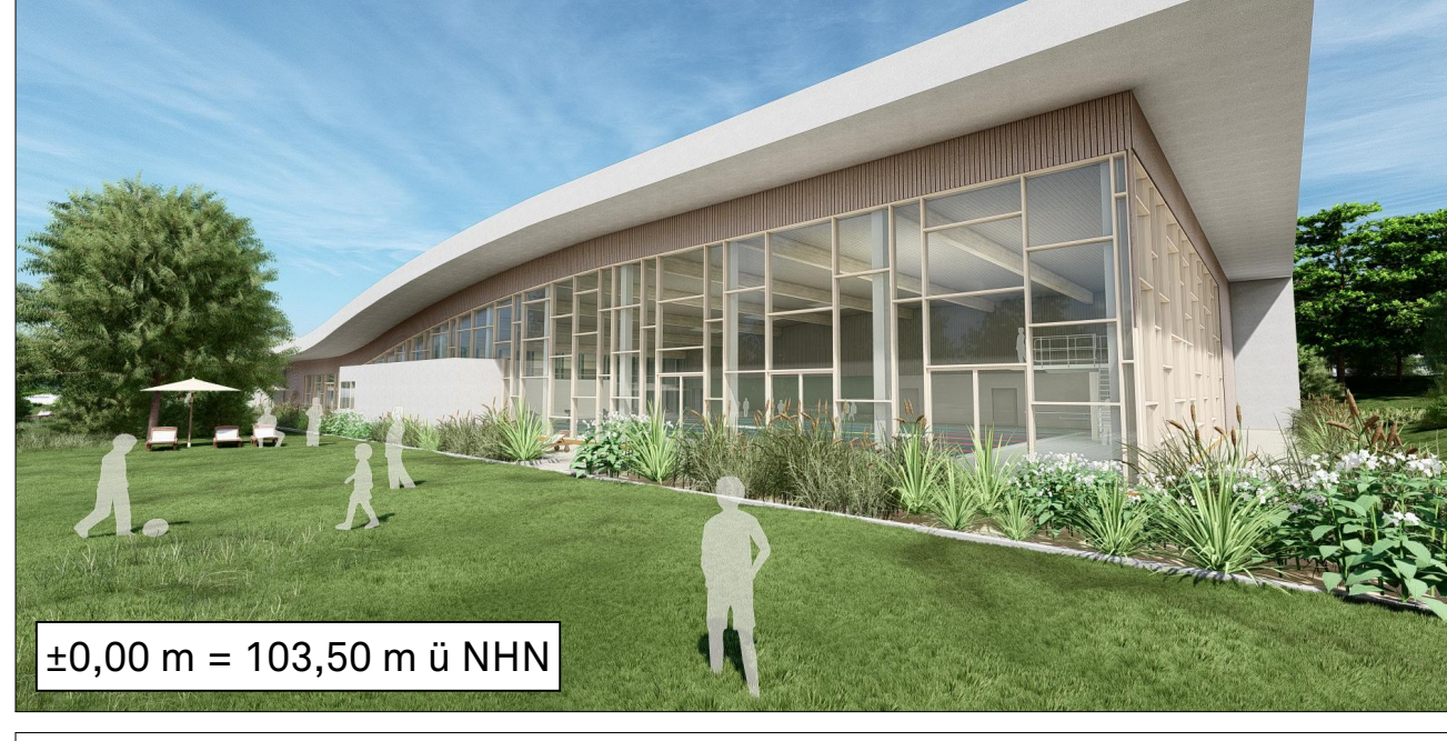
+0,00 m = 103,50 m ü NNH

Bauherr-In: _____ Architekt: _____ Ort, Datum: _____ Ort, Datum: _____