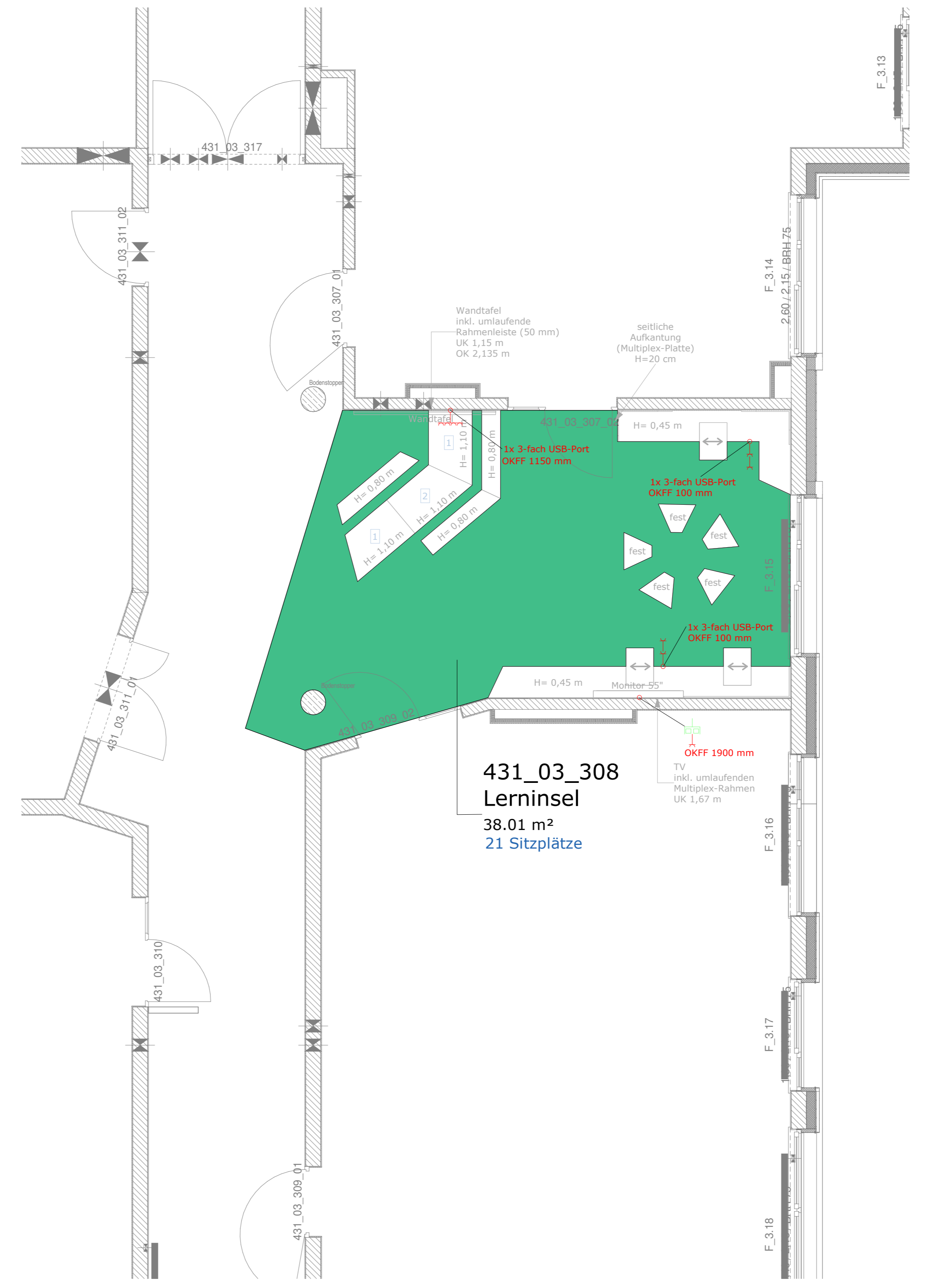
431_03_308 Lerninsel 38.01 m 2 21 Sitzplätze