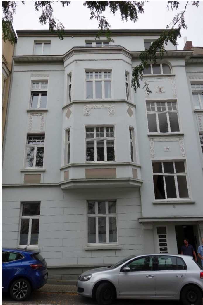
Mülheim an der Ruhr, Leibnizstraße 10, straßenseitige Ansicht (rechte Gebäudeachsen sind angeschnitten), Foto: Nadja Fröhlich (NF), LVR-ADR 2022.

Das aus massivem Ziegelmauerwerk errichtete dreigeschossige Reihenhaus ist verputzt und hell gestrichen. Sockel und Erdgeschoss ziert eine Putzbänderung. Die Brüstungsfelder und Fensterstürze sind mit floralen Stuckapplikationen, von Perlstabfriesen gerahmten Kartuschen und Rauten dekoriert. Die straßenseitige Fassade ist additiv gestaltet: die drei linken Achsen bilden eine Fassadenebene aus, die sich über einen nach Norden hin ansteigenden Sockel erhebt. Die rechte äußere Achse dieser Fassadenebene krägt leicht risalitartig hervor. Im Erdgeschoss befindet sich die erneuerte Haustür nebst erneuerten Briefkastenfächern, die durch Putzpilaster portalartig gerahmt und von einem geraden Dächlein überhöht wird. In der mittleren Achse krägt ab dem ersten Obergeschoss ein zweigeschossiger Erker mit abgeschrägten Seiten hervor. Ein weit hervorkragendes Traufgesims mit Perlstabfries und unterseitiger Kassettierung leitet zur veränderten, dreiachsigen Dachzone mit erneuerten Fenstern über. Rechterhand schließen eine vierte und fünfte, deutlich zurückliegende Gebäudeachse an.