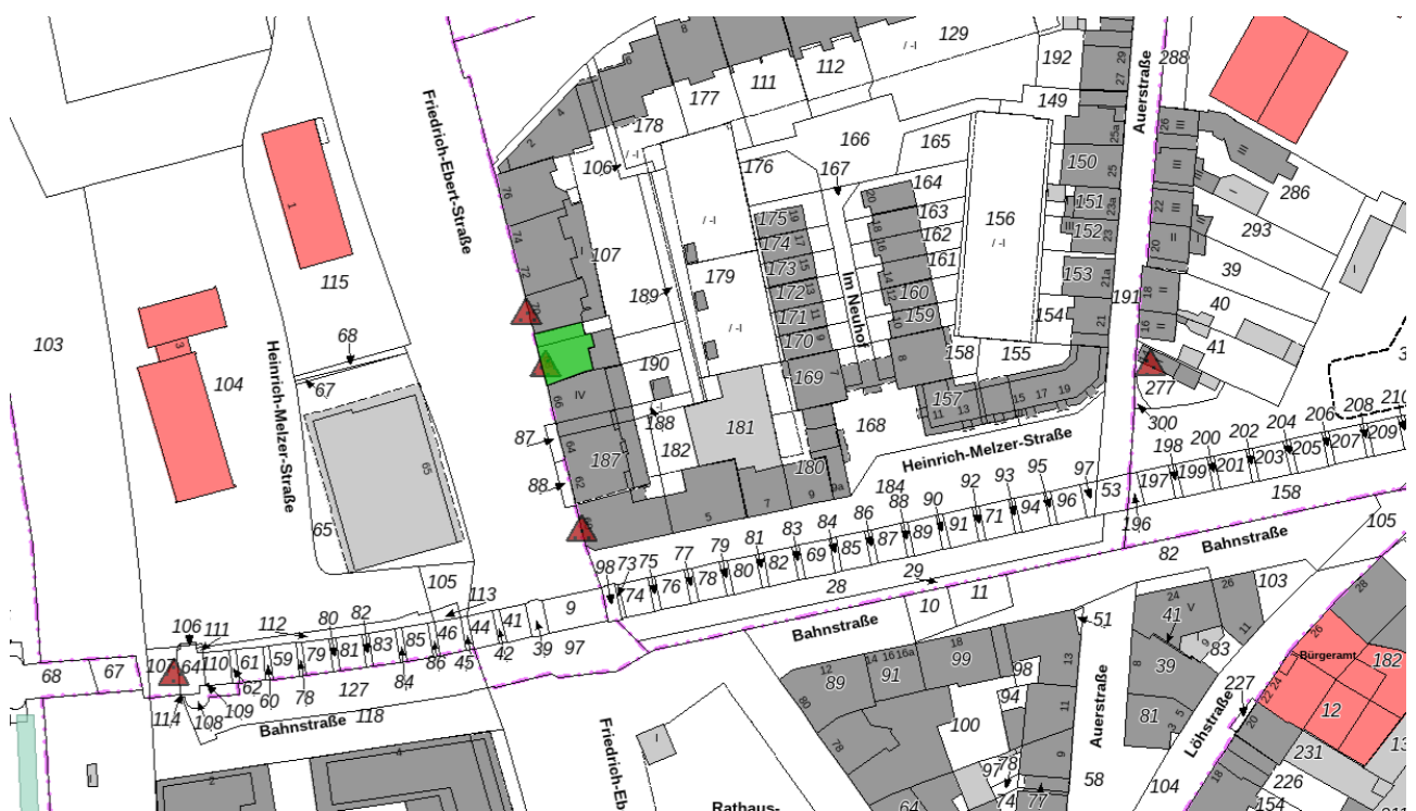
Mülheim an der Ruhr, Friedrich-Ebert-Straße 68, Kartenausschnitt (unmaßstäblich), denkmalwerter Schutzzumfang grün kartiert, rote Dreiecke: rechtskräftig eingetragene Baudenkmäler, 01/2024.

Im denkmalwerten Schutzzumfang sind das Äußere und das Innere des o.g. Baudenkmals in bauzeitlicher Substanz, Konstruktion, Erscheinungsbild und Ausstattung, wie im Folgenden beschrieben, enthalten. Die nachträglich errichteten Anbauten auf der Rückseite sind nicht Bestandteil des Schutzzumfangs. Der räumliche Schutzzumfang ist dem folgenden Kartenausschnitt zu entnehmen: