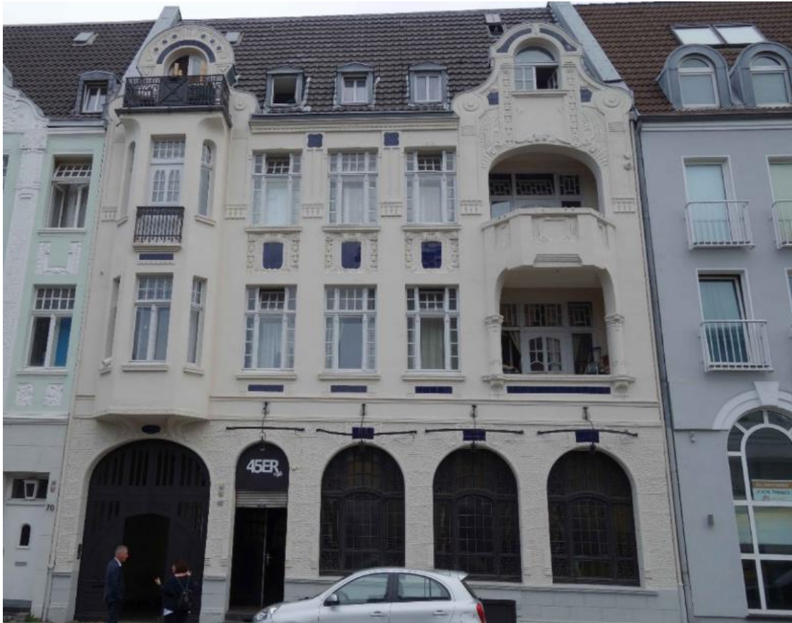
Mülheim an der Ruhr, Friedrich-Ebert-Straße 68, Straßenseite, Foto: Nadja Fröhlich (NF), LVR-ADR 2023.