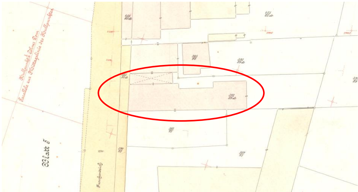
Ausschnitt Urkarte, Flur 49, Blatt 3a aus dem Jahr 1911, Mehrfamilienhaus mit Tordurchfahrt und rückwärtige Anbauten sind kartiert, Quelle: Amt für Geodaten, Kataster und Wohnbauförderung, Stadt MH/Ruhr.

Für den Bau des Mehrfamilienhauses wurden im Jahr 1905 ältere Bestandsgebäude abgebrochen. Die Einmessung des Neubaus erfolgte 1911. Demnach ist das Wohnhaus zwischen 1905 und 1911 errichtet worden.