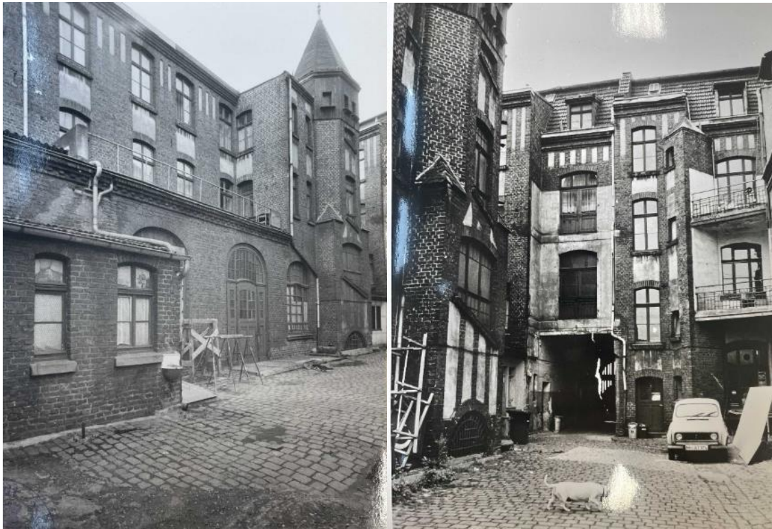
Links: Rückwärtige mehrgeschossige Anschlussbebauung mit Treppenturm (abgerissen), rechts: Rückseite (Achse über Hofdurchfahrt), Aufnahmen um 1965, Repros von Fotos aus dem StA Mülheim an der Ruhr, Sign. 1510/15.90.

Wohnungsbau saniert und restauriert wurden. Im Zuge dieser Sanierung sind bedauerlicherweise die Rückseite verändert und die rückwärtige Anschlussbebauung aus der Bauzeit abgerissen worden. Die Wohnungen wurden umfassend modernisiert (u.a. Erneuerung der Bodenbeläge und der Sanitäranlagen).