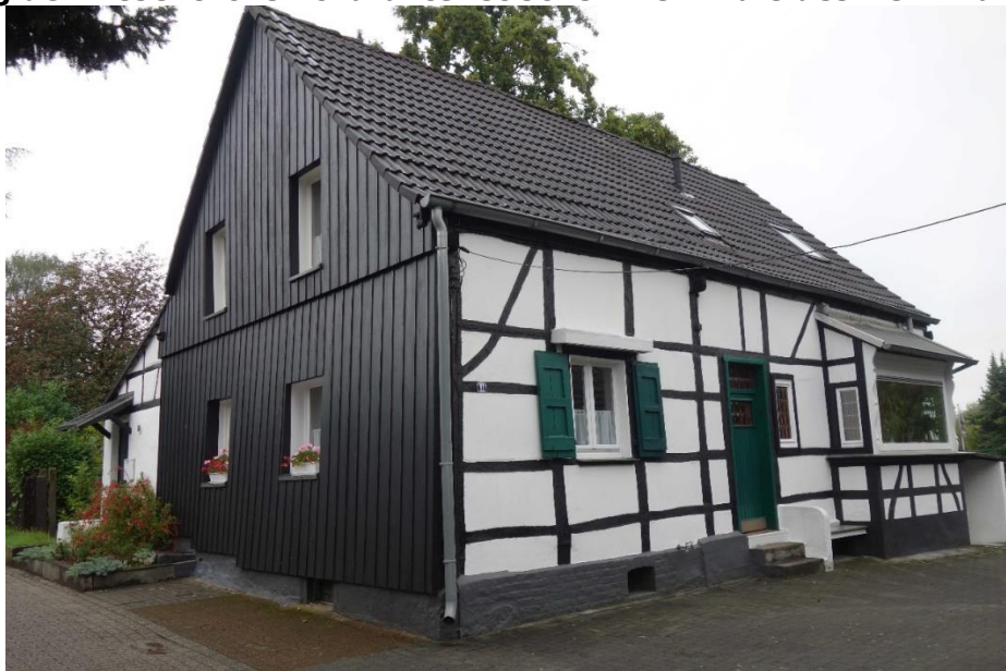
Mülheim an der Ruhr, Folkenborntal 11, östliche Traufseite, Foto: Nadja Fröhlich, LVR-ADR, 2022.