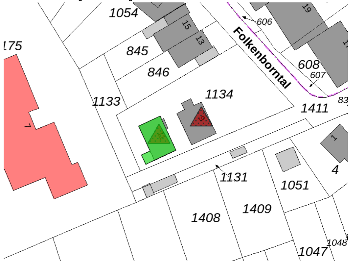
Mülheim an der Ruhr, Folkenborntal 11, Ausschnitt ALKIS-Karte, Schutzzumfang durch LVR-ADR grün kartiert, Stand 03/2023.

Im denkmalwerten Schutzzumfang sind das Äußere und das Innere des Fachwerkkottens in historischer Substanz, Konstruktion, Erscheinungsbild und Ausstattung, wie im Folgenden beschrieben, enthalten. Der räumliche Schutzzumfang ist dem folgenden Kartenausschnitt zu entnehmen: