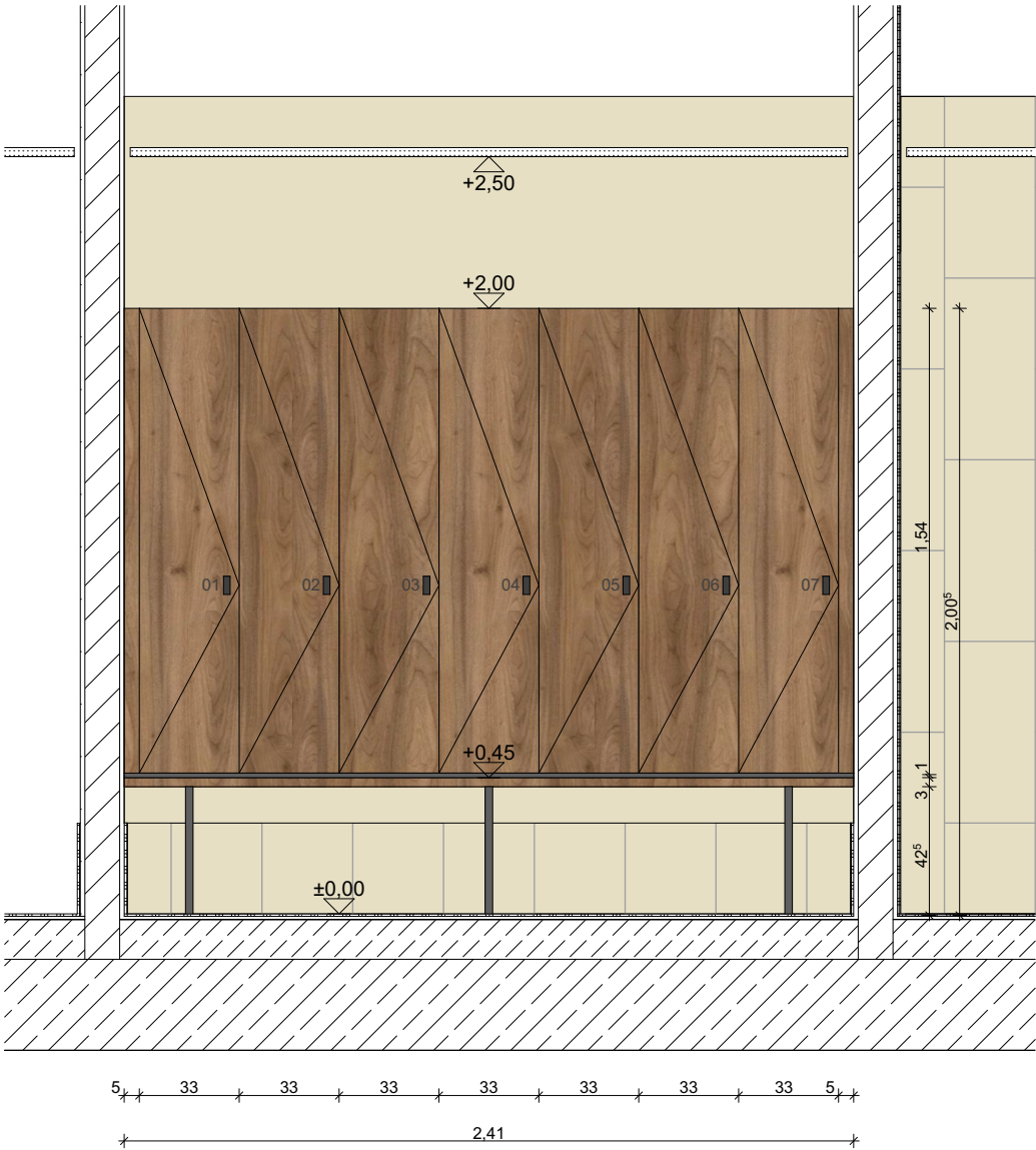
Ansicht - Umkleideschränke Personal Herren