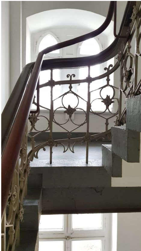
Foto 001 Treppenhaus "A" noch nicht entschichtetes Geländer mit Erhöhung